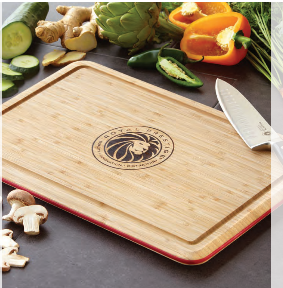
TABLA PARA CORTAR DE BAMBÚ

Ideal for sharpening straight-edge blades.